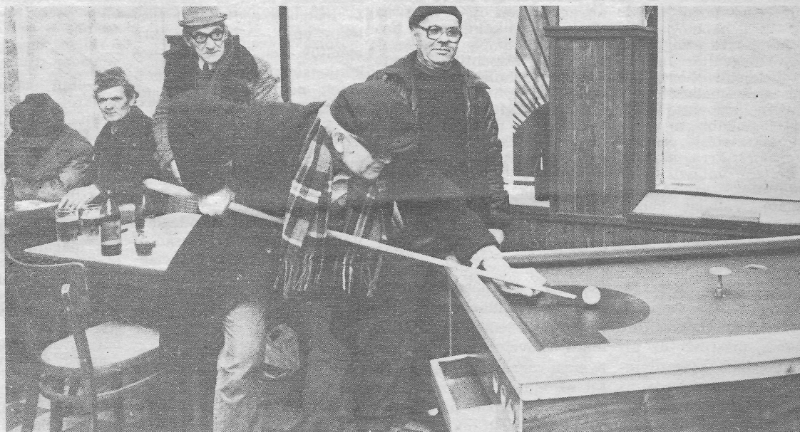
„Élénk a társasági élet”