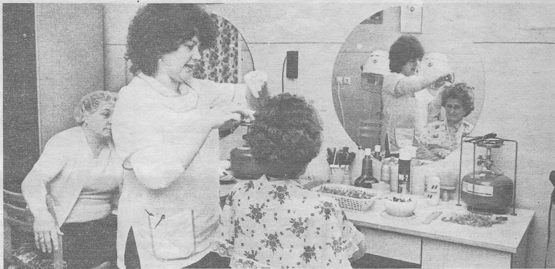
Itt előbb vagy utóbb minden helybeli megfordulni kénytelen

S mintha erre a végszóra várt volna, felhangzik azon nyomban a pult mini-hifi-tornyából a lakodalmas rock behízelgő hangú énekesének kontrája. „Kibírom én, akár-hogy is fáj.”