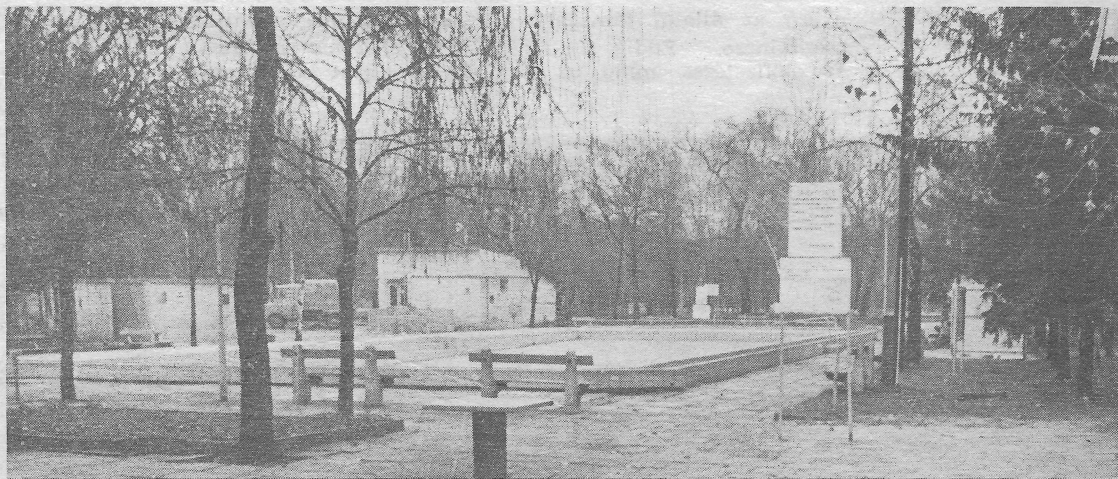
Most csendes a népszerű, kedvelt lubickolóhely